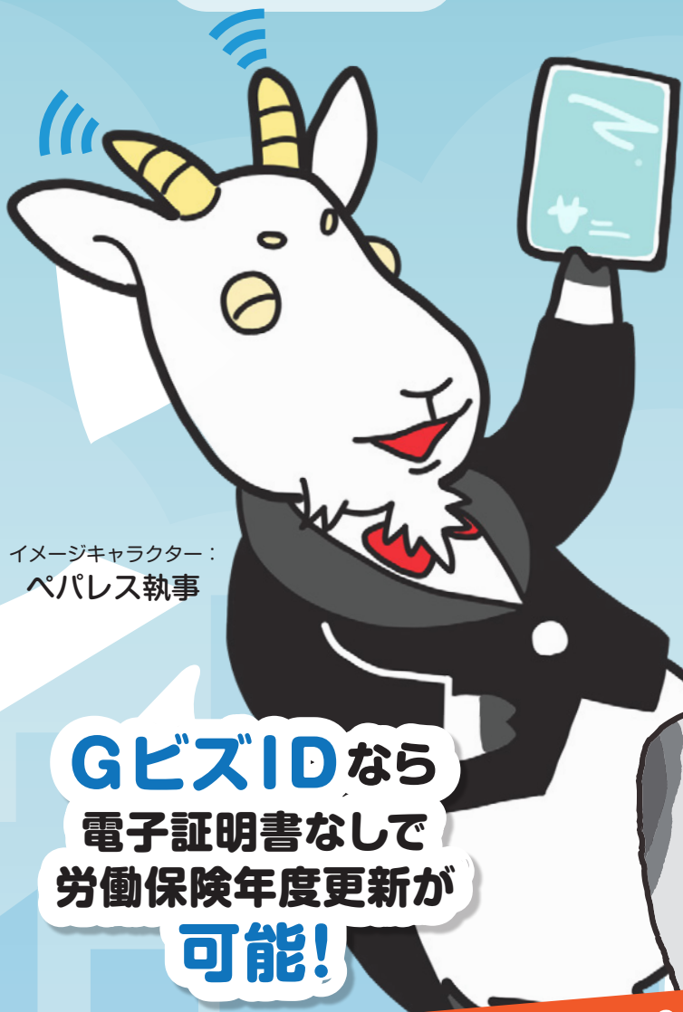
イメージキャラクター： ペパレス執事