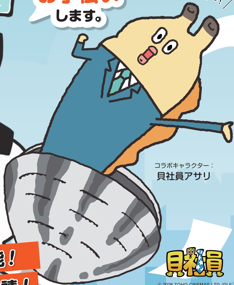
コラボキャラクター： 貝社員アサリ